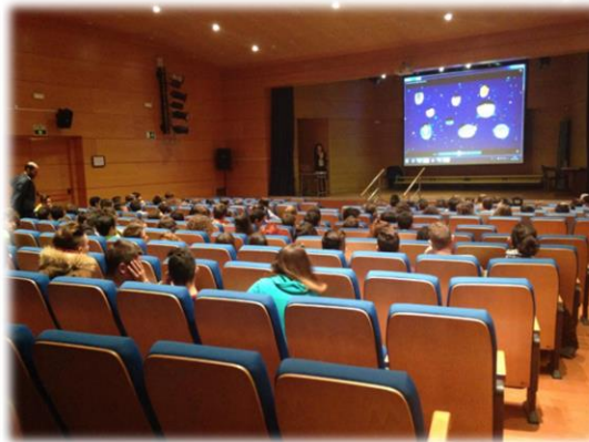
Exposiciones y charlas debate en IES Atenea, Juan de Ávila y Hernán Pérez del Pulgar.