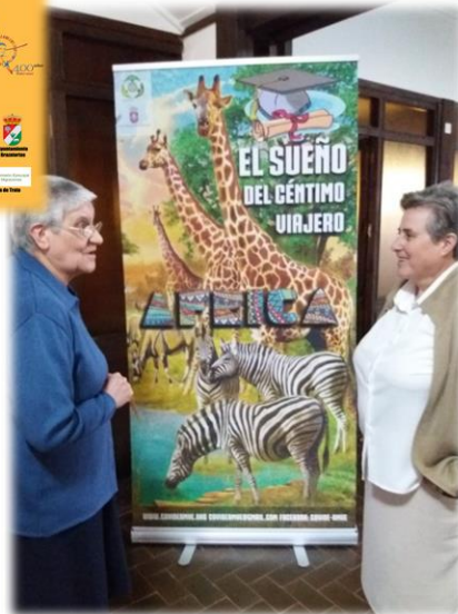
Promoción de becas-ayuda al estudio para niñas en África.