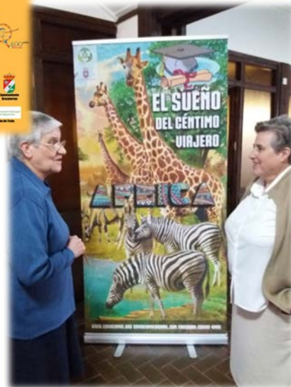
Promoción de becas-ayuda al estudio para niñas en África.