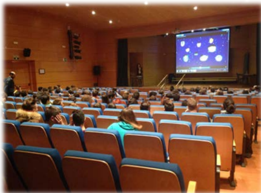
Exposiciones y charlas debate en IES Atenea, Juan de Ávila y Hernán Pérez del Pulgar.